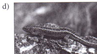
Ještěrka obecná – samec